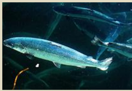
Feilmontering førte i 2009 til at det ble hull i laksenoten, og 80.000 fisk slapp ut i havet.

■ Oppdrettsfirmaet Nova Sea må betale en bot på 500.000 kroner for å ha satt opp en uforsvarlig oppsatt laksemerd på Helgeland. Selskapet satte opp laksemerden i Sjona på Helgelandskysten høsten 2008, men noten ble ikke festet til bunnringen i henhold til leverandørens anvisninger. Politiet på Helgeland mener selskapet både har brutt akvakulturloven, straffeloven og forskriften om akvakulturansettelse og har ilagt selskapet en bot på 500.000 kroner. ©NTB