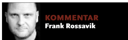
KOMMENTAR Frank Rossavik

Hva skal vi vel med demokrati hvis alt ellers går greit?