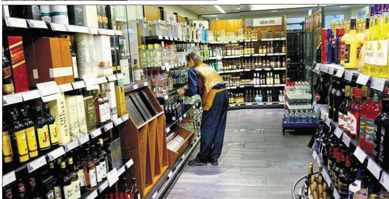
Gro Harlem Brundtland fremforhandlet EØS-avtalen på starten av 1990-tallet. Norges ordninger med vinmonopol, spillmonopol og offentlig kraftetterskap er noen av temaene domstolene har behandlet i de 17 årene som har gått etter EØS-avtalen ble innført.