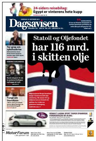
Dagsavisen 19. oktober.