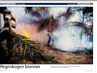
Dagsavisen 22. oktober.