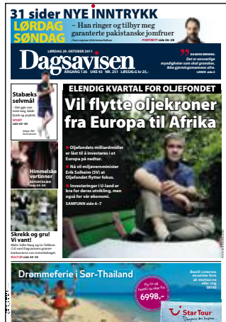
Dagsavisen 29. oktober.